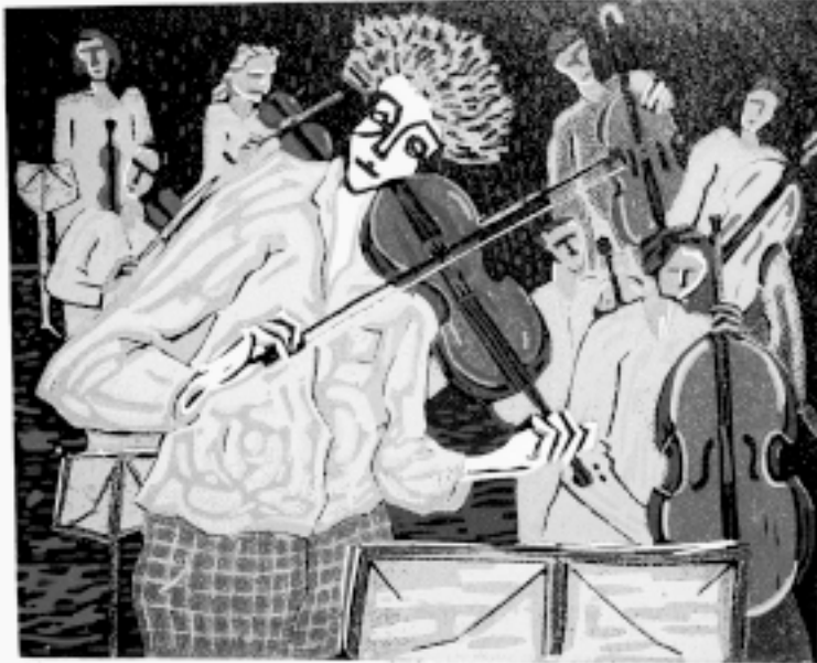
Assaig d'orquestra, linogravat.

Amb 16 tintes va gravar el 1988 aquesta panoràmica musical (25,5x20,8). En ella dóna un tractament molt diferent a la figura del protagonista i al conjunt de músics que l'envolten, ja que mentre en tots els músics del conjunt matisa el vestuari, al xicot del primer terme li dóna un ratllat enèrgic que no sembla una vestimenta diferent de la dels altres perquè totes estan acolorides en verd, sinó que és la causa de les vibracions del seu propi cos acompanyant el violí. Tot en ell es fon amb la música que interpreta: les seves mans estan finament gravades perquè treuen de l'instrument un so especialment delicat i els ulls clucs ens transmeten també, l'emoció del moment que està vivint. Les cares de la resta estan només insinuades, però podem llegir les diferents expressions en cadascuna d'elles.