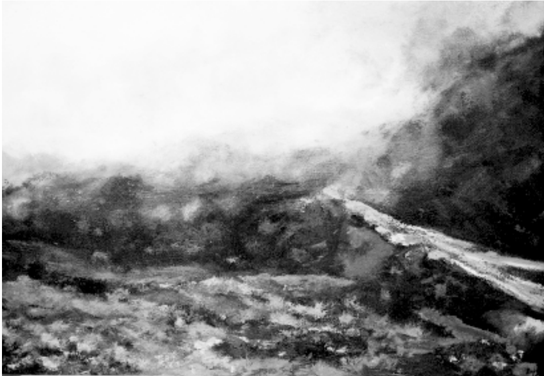
Paisatge d'hivern, Oli sobre tela.

Aquesta tela (100x81) pintada l'any 1991, podria ser, segons expressa el propi autor, el camí per on ara voldria dirigir el seu camp d'experimentació. És a dir, jugant amb els colors, vol donar unes formes indefinides, però suggerents, que ens transfereixin als espectadors un punt de reflexió, més que de percepció, de manera que haguem de buscar-hi el nostre propi paisatge, més que el panorama definit de tal o tal terme i on la brillantor d'uns tons vingui donada pel contrast dels seus complementaris i la gradació dels colors ens apuntin a un possible fons que podrem vestir segons el nostre desig o el nostre estat d'ànim.