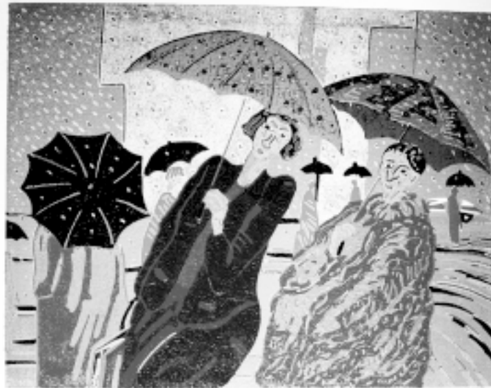
Dia plujós, linogravat.

Amb 16 tintes va gravar el 1988 aquesta panoràmica musical (25,5x20,8). En ella dóna un tractament molt diferent a la figura del protagonista i al conjunt de músics que l'envolten, ja que mentre en tots els músics del conjunt matisa el vestuari, al xicot del primer terme li dóna un ratllat enèrgic que no sembla una vestimenta diferent de la dels altres perquè totes estan acolorides en verd, sinó que és la causa de les vibracions del seu propi cos acompanyant el violí. Tot en ell es fon amb la música que interpreta: les seves mans estan finament gravades perquè treuen de l'instrument un so especialment delicat i els ulls clucs ens transmeten també, l'emoció del moment que està vivint. Les cares de la resta estan només insinuades, però podem llegir les diferents expressions en cadascuna d'elles.