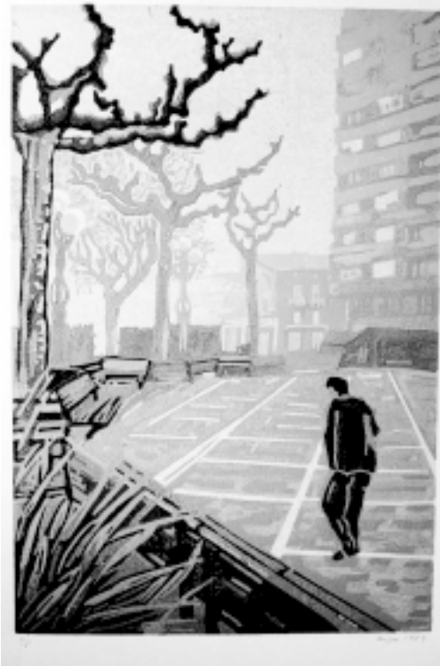
El pati- Tàrrrega , linogravat.

Aquesta vista del Pati de Tàrrrega (32,5x22), gravada el 1989, està realitzada amb 15 tintes i per això podem veure-hi la presència de l'hivern que es manifesta en un cel grisós - però no uniforme de color- i en una atmosfera espessa que desdibuixa les cases del fons, que s'apunten només com una insinuant ombra, mentre que en primer terme hi brillen els verds de les plantes i els carabasses del primer banc.