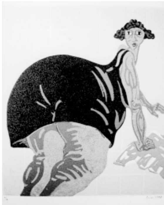
Dona fregant , linogravat.

Aquesta vista del Pati de Tàrrrega (32,5x22), gravada el 1989, està realitzada amb 15 tintes i per això podem veure-hi la presència de l'hivern que es manifesta en un cel grisós - però no uniforme de color- i en una atmosfera espessa que desdibuixa les cases del fons, que s'apunten només com una insinuant ombra, mentre que en primer terme hi brillen els verds de les plantes i els carabasses del primer banc.